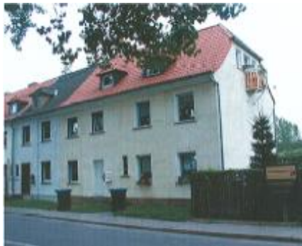
Bild 1 Außenansicht

Ermittlung des bergbaulichen Einflusses auf das Schadensbild