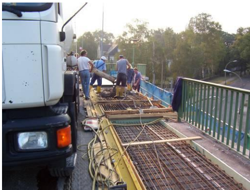
Bild 1 Kappenerneuerung, Deckenbuch

Instandsetzung der Brücke im Zuge der B 101 über die Strecke der Deutsche Bahn AG, Elsterwerda