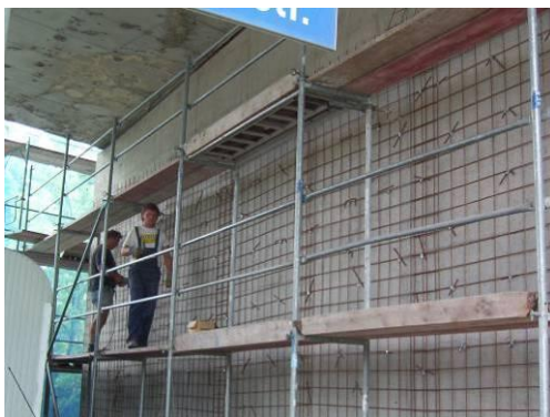
Bild 3 Spritzbeton Widerlagerwände nach ZTV - SIB