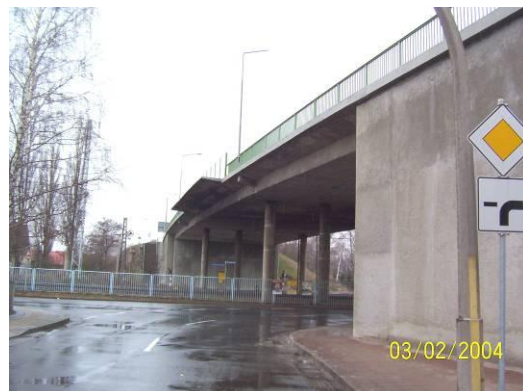
Bild 4 Spritzbeton Widerlagerwände nach ZTV - SIB