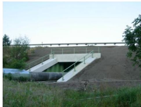
Bild 3 Neubauwerk