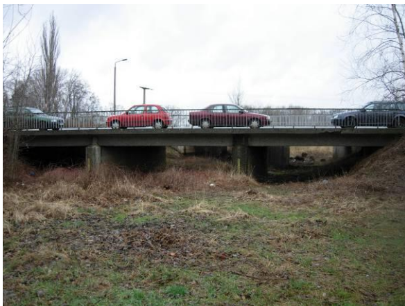
Bild 2 Bestandsbauwerk