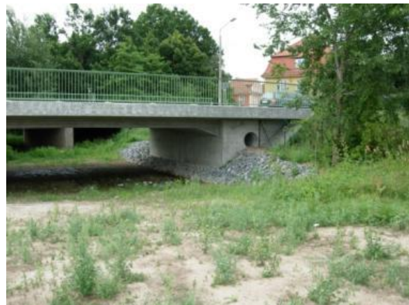
Bild 3 Neubauwerk