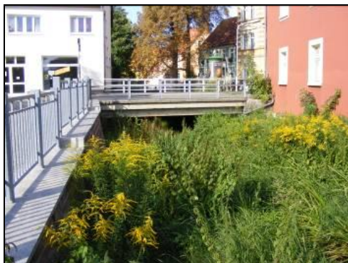
Bild 2 Bestandsbauwerk