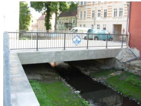
Bild 3 Neubauwerk