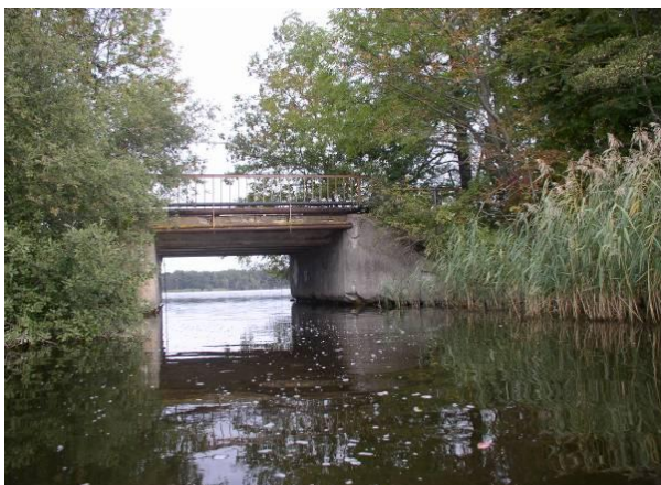
Bild 2 Bestandsbauwerk