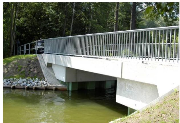
Bild 3 Fertiggestellte Brücke